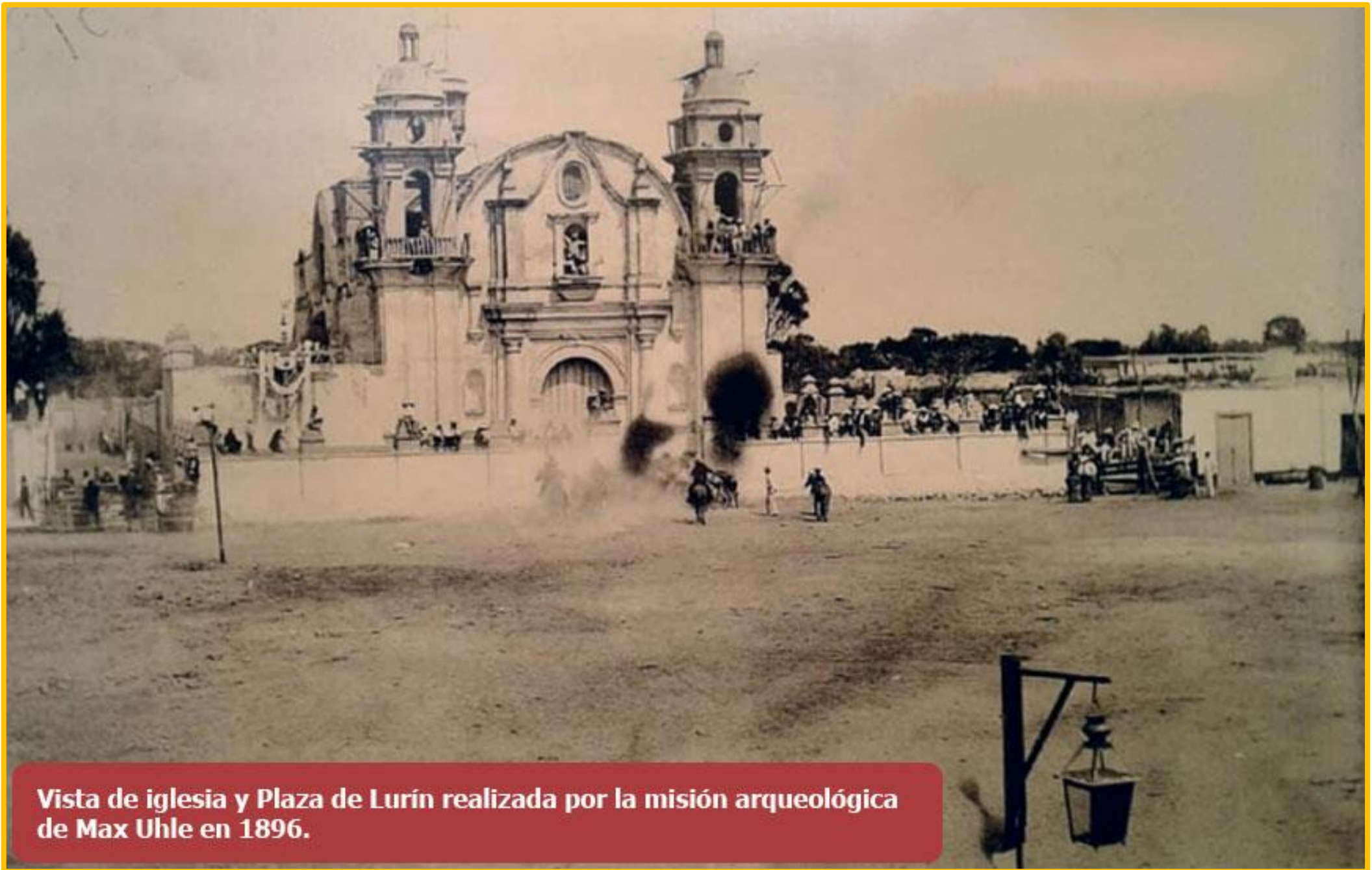
Vista de iglesia y Plaza de Lurín realizada por la misión arqueológica de Max Uhle en 1896.